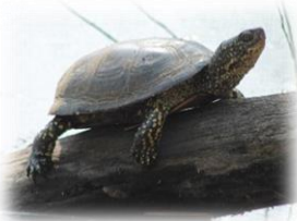
La Cistude d'Europe