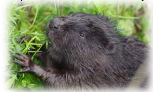
Le Castor d'Europe