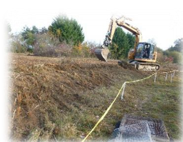
Restauration de sites de pont de Cistude