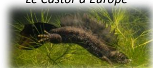
Le Triton crêté