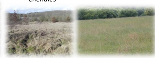
Prairie humide à Molinie et prairie maigre de fauche et vases exondées