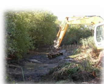
Restauration et création de mares