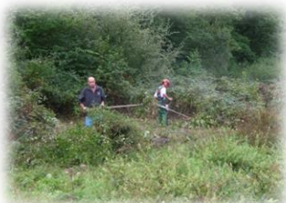
Débroussaillage de prairie humide

N'hésitez pas à nous contacter pour plus de renseignements.