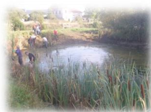
Entretien de la végétation humide